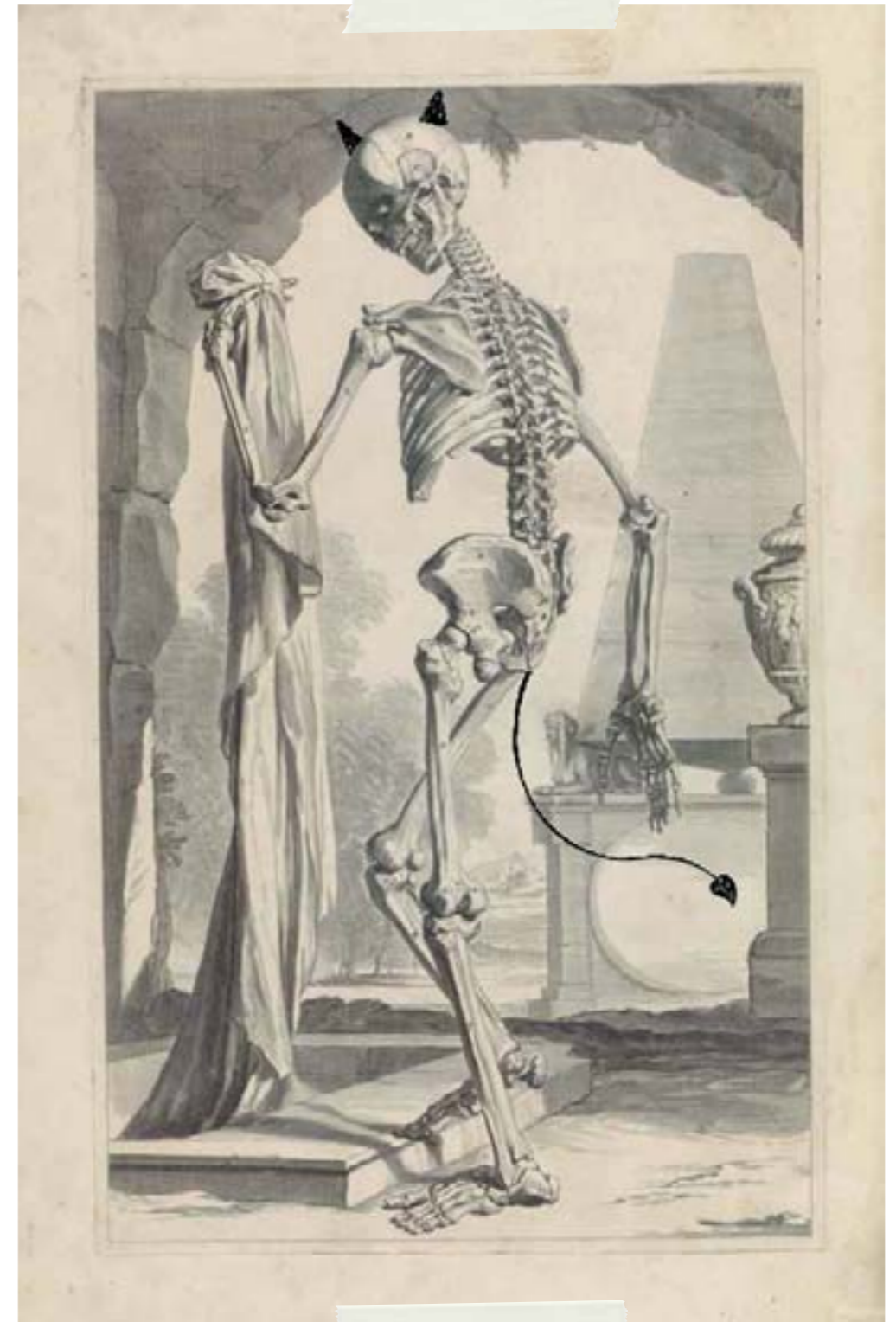
Model szkieletu. Pieter van Gunst, wg Gerarda de Lairese'a, 1685

Ludzie pochodzą od podobnych do małp stworzeń , które mieszkały na drzewach i pomagały sobie ogonami podczas wspinaczki . Gdy nasi przodkowie zaczęli poruszać się po ziemi i nie potrzebowali już ogonów do chwytania gałęzi, powoli zaczęły one zanikać . Kość ogonowa człowieka jest pozostałością po części ciała, która przestała nam być potrzebna.