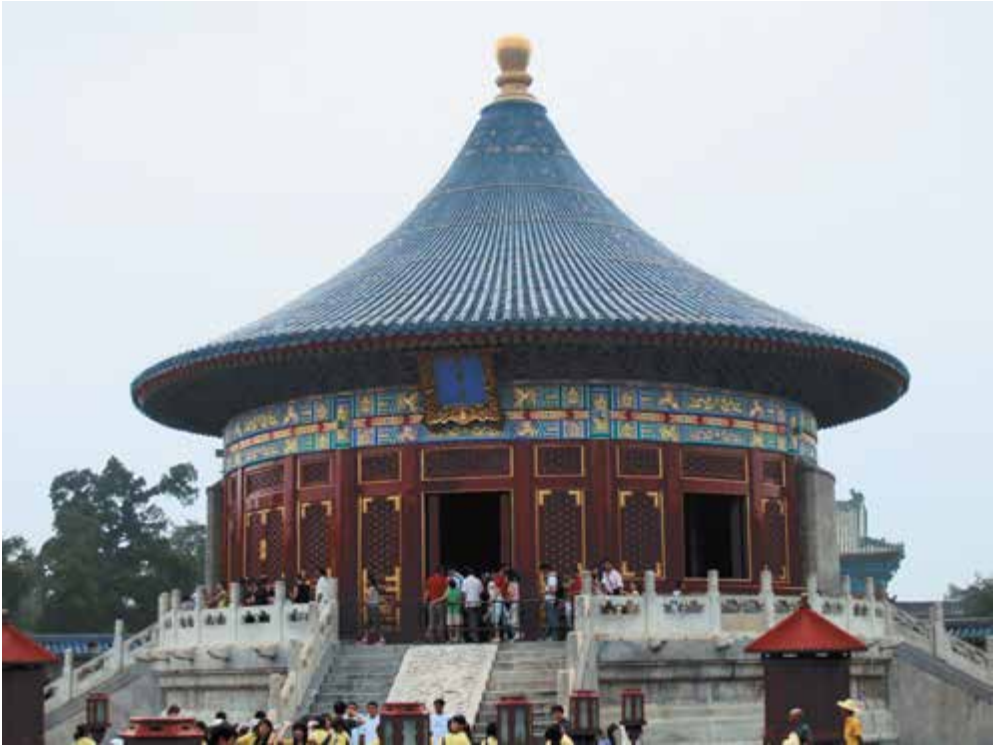
Ryc. 22. Świątynia Modlitwy o Doroczny Urodzaj