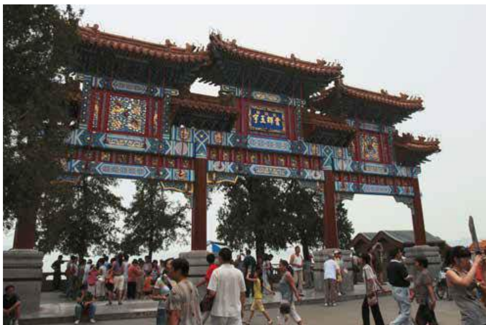
Ryc. 9. Park Beihai, stan współczesny