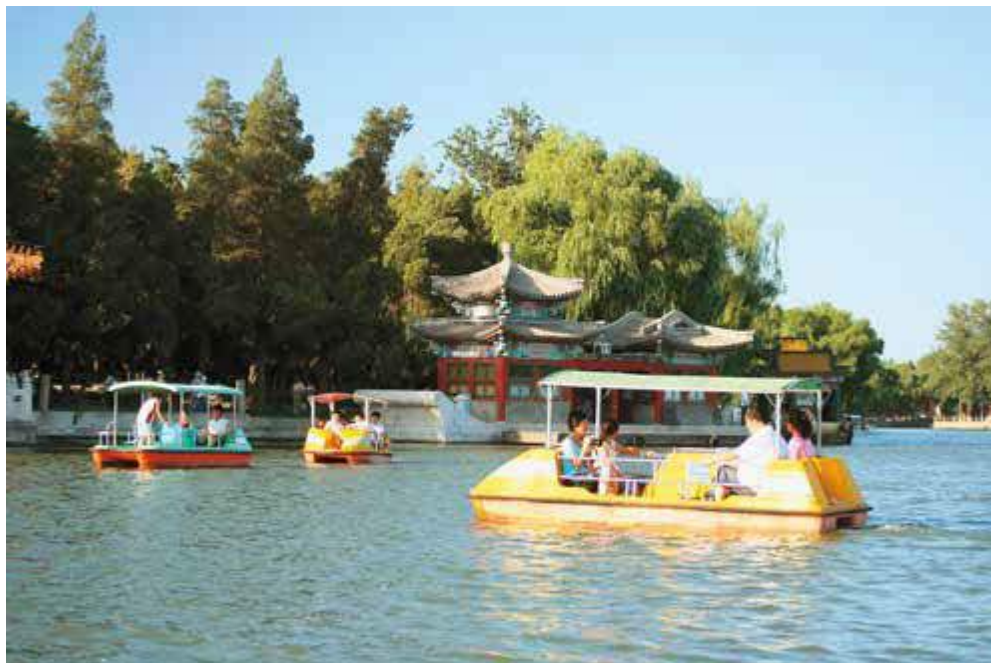
Ryc. 7. Fragment parku Beihai, stan współczesny

zupełnie zadrzewienia, co podkreślało jej odmienność – większą oficjalność, surowość i monumentalność. Z jednym wyjątkiem – kanały wewnątrz dziedzińców zostały przeprowadzone wzdłuż linii krzywych, co przypomina zasadę Yin i Yang. Pałace cesarskie odznaczały się barwami. Z białego marmuru budowano tarasy, które błyszcząły w pełnym słońcu kontrastując z czerwienią kolumn i murów, dachówka pokrywająca dachy budowli pokryta była żółtą glazurą, a wsporniki i belki wypełnione były barwną polichromią. Ogólną kolorystykę uzupełniała zieleń przyległego ogrodu. Kolor dachu odpowiadał pozycji społecznej właściciela domu, budynki zwykłych obywateli były szare (ryc. 6).